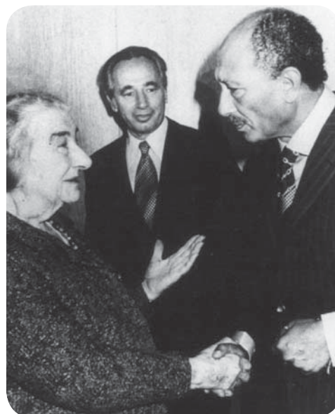
Meir en Sadat schudden elkaar de hand tijdens Sadats bezoek aan Israël.

Golda Meir (1898–1978) is een van de oprichters van de Arbeiderspartij na de Zesdaagse Oorlog. Zij is eerste minister van Israël van 1969 tot 1974. Na de Jom-Kipoeroorlog wordt zij tot aftreden gedwongen onder druk van de publieke opinie die het de politici verwijt dat zij zich tijdens de oorlog hebben laten verrassen.