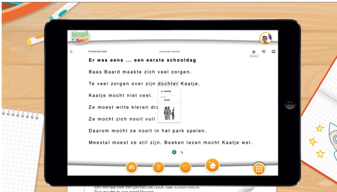
Een tekst van TALENT in de Insluitende lezer-software op Bingel Raket